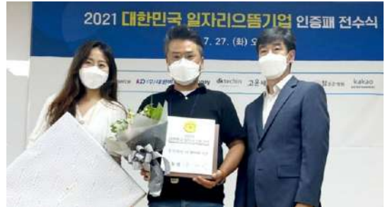
2021년 일자리 으뜸 기업 선정