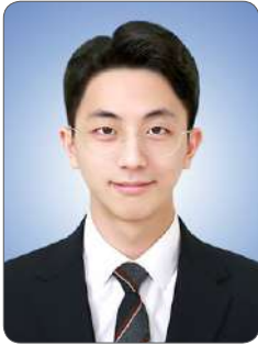
김 O 윤