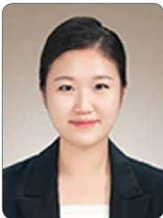
이 O 정

6개월의 과정동안 처음부터 끝까지 열정을 다해 가르쳐주신 지도교수님과 과정 이후에도 지속적으로 취업지원을 해주신 한국소프트웨어산업협회 관계자 분들께 진심을 담아 감사의 말씀을 드리며, 개발자로 취업을 희망하시는 분들께 한국소프트웨어산업협회에서 진행하는 교육과정을 수료하는 것을 추천드립니다!