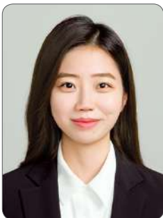
김 O 나

그동안 교육과정에 힘써주신 교수님들 선임님들께 감사인사를 드리며 입과를 희망하시는 분들이 계신다면 한국소프트웨어산업협회(KOSA)의 교육과정을 적극 추천 드립니다.