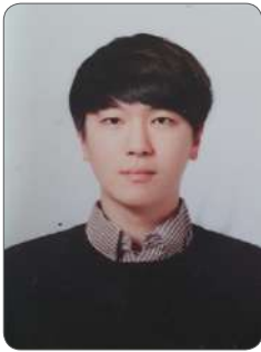
반 O 진