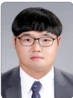
황 O 욱