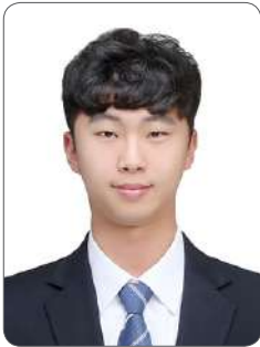
방 O 훈