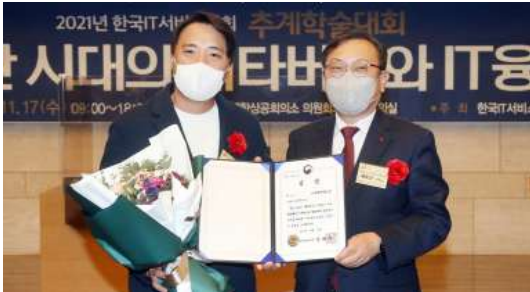
2021년 대한민국 IT서비스 혁신 대상 일자리 혁신 부문 과학기술정보통신부 장관상 수상