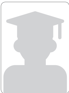
조 O 호