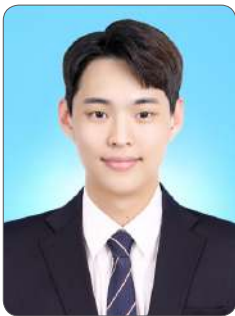
이 O 범

한 회사만을 바라보고 교육을 듣는다는 것이 두려울 수는 있지만 확정형 교육을 통해 얻는 다른 장점들이 너무나도 많이 있다고 느낍니다. 교육기간 동안 교육생들 필요한건 없는지 챙겨주시던 선임님들, 잘 짜여진 커리큘럼과 교수님들의 헌신덕분에 지금의 제가 있는 것 같습니다. 이러한 이유들로 저는 KOSA를 믿고 채용 확정형 교육을 들어보는 것을 추천드립니다!